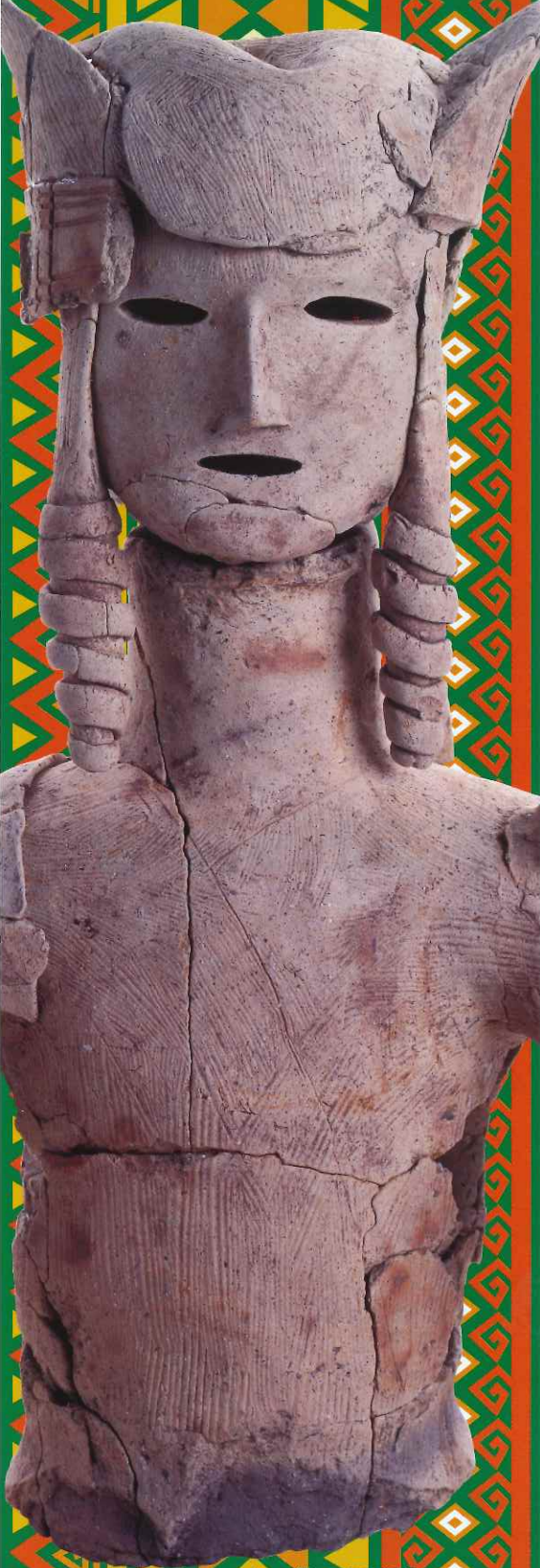
盛装した男子埴輪 (池田9号墳 大和高田市教育委員会蔵)

〒690-0033 松江市大庭町456 TEL:0852-23-2485 http://www.yakumotatu-fudokinooka.jp