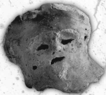
人面付土器<弥生時代> (目垣遺跡 茨木市教育委員会蔵)