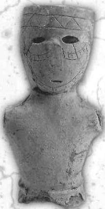
入れ墨の男性の埴輪<古墳時代> (荒時古墳 天理市教育委員会蔵)