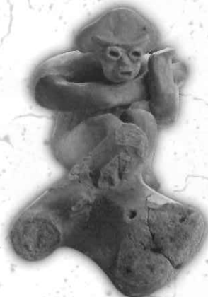
土偶<縄文時代> (下山遺跡 島根県埋蔵文化財調査センター蔵)