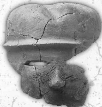
入れ墨のある人物埴輪<古墳時代> (平所遺跡 島根県教育委員会蔵)