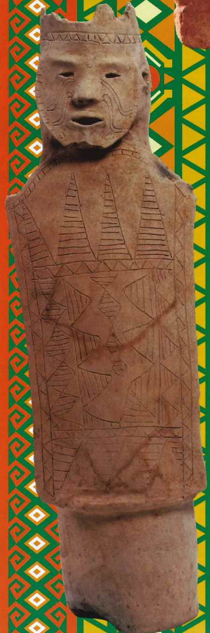
盾持人埴輪 (井出挾3号墳 米子市教育委員会蔵)