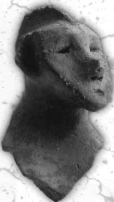
人面付土器<弥生時代> (西川津遺跡 島根県埋蔵文化財調査センター蔵)