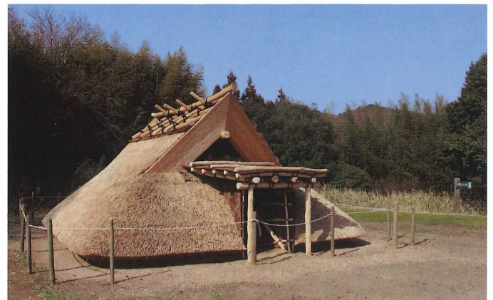
2024年春、竪穴住居をリニューアルしました