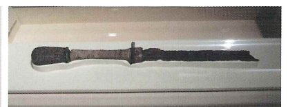
額田部臣銘文入大刀